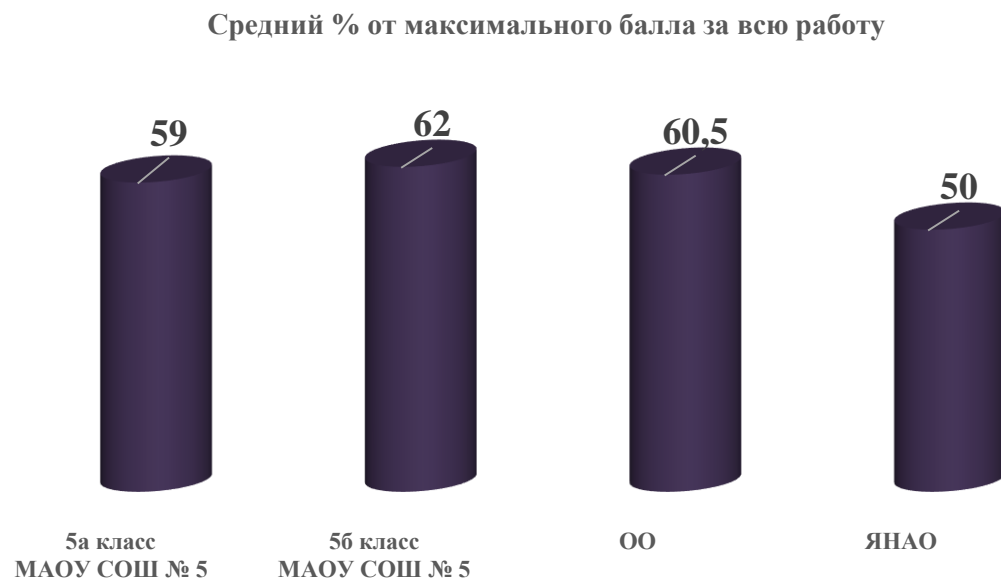
Диаграмма 1. Успешность выполнения диагностической работы по английскому языку

Анализируя данные диаграммы, отметим, что наиболее успешно с диагностической работой по английскому языку справились обучающиеся 5б класса МАОУ СОШ № 5. Средний процент от максимального балла за выполнение всей работы в этом классе составил 62 %, что превышает муниципальный и окружной показатель на 1,5 % и 12 % соответственно.